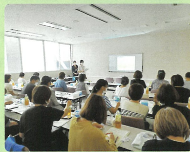
動きやすい服装でお越しください