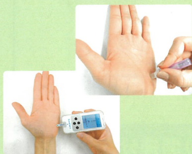
昼食前、食後の計5回測定