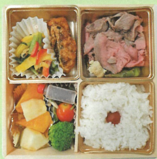
栄養バランスの解説