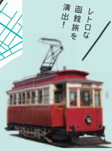
箱館市電のレトロ電車「箱館ハイカラ号」 4月中旬から10月末までの主に土日祝日に運行。